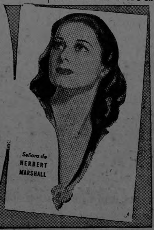
Señora de HERBERT MARSHALL

¡SOLO TANGEE LA HARA VER... LO LINDA QUE QUIERE SER!